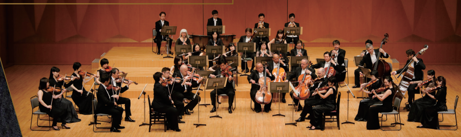
管弦楽 オーケストラ・アンサンブル金沢