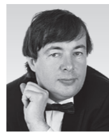
オレグ・ポリャンスキー (ピアノ) Oleg Poliansky

1968年キエフ(ウクライナ)に生まれる。キエフ中央音楽学校を経て1986年グネーシン音楽大学に進んだ。1991年より1993年までモスクワ音楽院でS.ドレンスキーに師事する。モントリオール国際音楽コンクール(1988年)第3位、第11回チャイコフスキー国際コンクール(1998年)第6位等数多くの国際コンクールで入賞を果たす。ケルン音楽大学で教鞭をとった後、現在はロシア、ウクライナ、ドイツ、イタリア、アメリカ、オーストラリア等世界中で演奏活動を行っている。