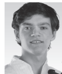
ミロ・フェラッツィーニ (チェロ) Milo Ferrazzini

1976年ルガーノ(スイス)に生まれる。国立ルガーノ音楽院で山下泰輔に、チューリッヒ音楽大学でラファエル・ウォルフに師事する。その後、ユース・ワールド・オーケストラで首席チェロ奏者を、バルマのアンサンブル・プロメテオでソリストを務めた。デニス・フェデリ、マリオ・アンシロッティ、ピエロ・ガンバ、ケビン・グワイス、ルイス・ゴレリック、レイナルド・ゼンバなど、世界的指揮者との共演も数多く果たす。また、EMI、Nuova Eraをはじめ数多くのレーベルからCDがリリースされている。使用楽器はバッティスタ・ザノーリによって1740年に製作されたもの。現在、トリオ・デ・アルプのチェリストとして世界中で演奏活動を行っている。