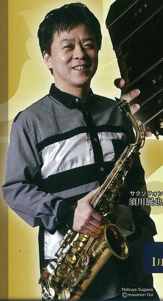
サクソフォオン 須川展也